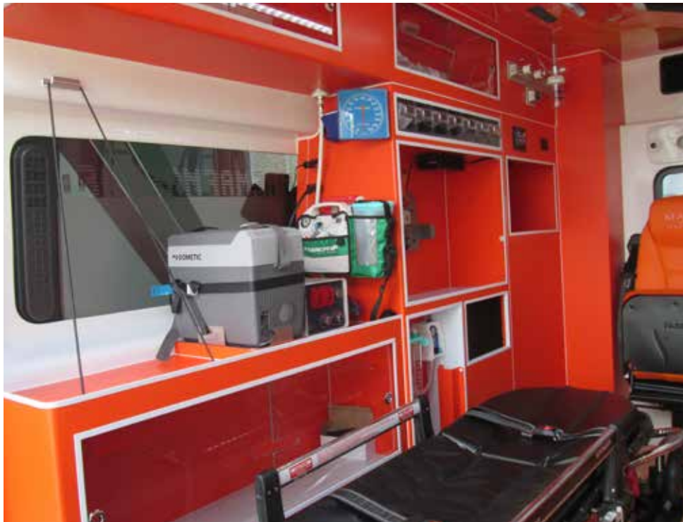
omnia 2 : la soluzione per il doppio portellone

La personalizzazione al massimo della sua espressione L'utilizzo del materiale LMP (laminato elettrozincato termorivestito) permette la massima modularità per un interno su misura